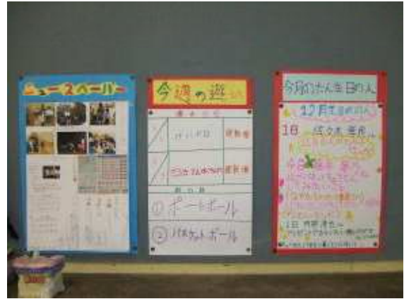
【係のお知らせコーナー】