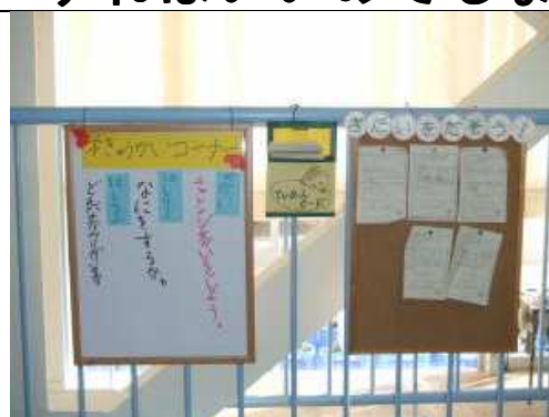
【議題提案カードと次の学級会のお知らせ】

A 教室に学級活動コーナーを作りましょう。学級活動コーナーには、今までの学級会の記録(議題の歴史・話し合って決まった内容)や次回の学級会のお知らせ、議題提案カードの提示場所を設けましょう。また、子どもたちが自由に書いたり貼ったりできる係活動コーナーも作るとういでしょう。